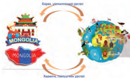
Төлбөрийн тэнцэл, агуулга

Энэ нь Монгол Улсын эдийн засгийн харьяат ба харьяат бусын хооронд хийгдэж буй бүх төрлийн ажил, гүйлгээг тусгадаг. Төлбөрийн тэнцэл нь тухайн тайлант үеийн ажил, гүйлгээгээр тайлагнагддаг бол гадаад хөрөнгө оруулалтын позицын тайлан нь өссөн дүнгээр тайлагнагддаг.