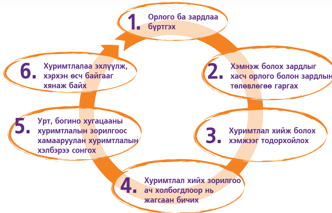
Зураг 2. Хуримтлал үүсгэх алхмууд