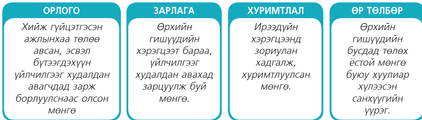
Зураг 1. Өрхийн төсвийн үндсэн ойлголтууд

Гэр бүлийн гишүүдийн нас, хүйс, боловсрол, эрхэлж буй ажил, мэргэжил зэргээс хамаараад өрхийн орлого харилцан адилгүй эх үүсвэрээс бүрддэг. Зарим өрхийн орлого зөвхөн цалин,