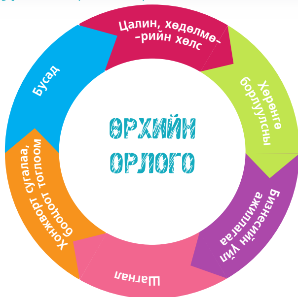
Зураг 2. Өрхийн орлогын ангилал

Өрхийн орлогыг олон шинжээр ангилж болох бөгөөд Зураг 2-т үзүүлсэн ангилал нь ХХОАТ-ын зорилгоор ангилсан ангилал юм. Үүнээс гадна жил бүр МУ-ын ҮСХ-ноос өрхийн сарын дундаж орлогын бүтцийг тодорхойлон гаргадаг. Үүнийг Зураг 3-аас харна уу.