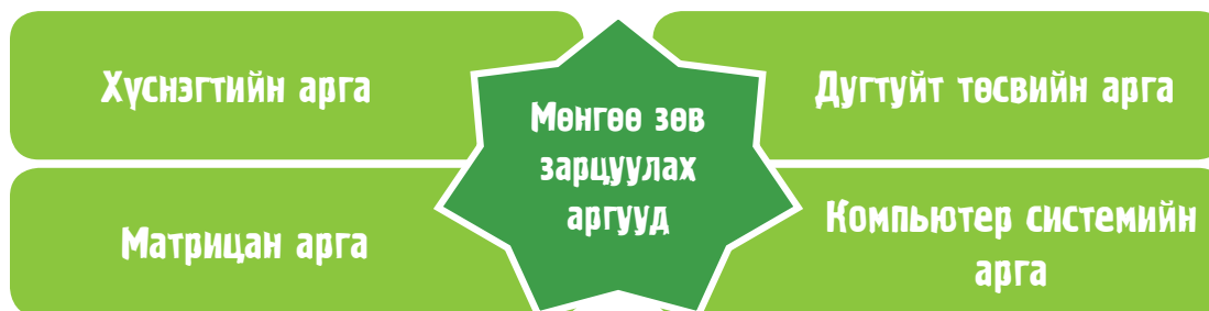
Зураг 6. Өрхийн төсөв зохиох аргачлал

Өрхийн төсөв зохиох хэд хэдэн арга байдаг бөгөөд Зураг 6-д өргөн ашигладаг, нийтлэг аргуудыг харууллаа.