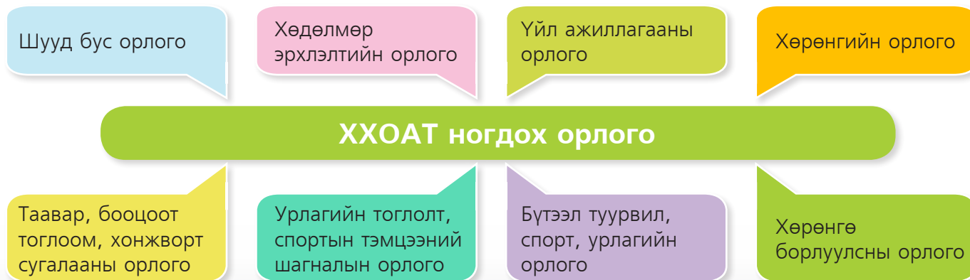
Зураг 2. ХХОАТ ногдох орлого

“Хувь хүний орлогын албан татварын тухай хууль”-д зааснаар хувь хүн олсон дараах орлогоосоо татвар төлнө. Өөрөөр хэлбэл, хувь хүний олсон орлогыг дараах байдлаар ангилдаг. Зураг 2-ыг харна уу.